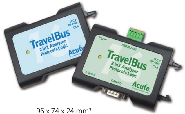
96 x 74 x 24 mm 3