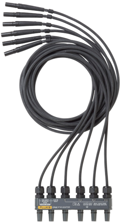
IP65 等級的電壓連接器 (選購)。

Fluke 以其體貼設計為傲，1740 系列電力品質記錄器包括如 MA-C8 變壓器等簡單而有效的配件，不在現場時可透過電源線輕易供電給儀器供電。包括乙太網路、USB、AUX 和 I/O 埠等在現場不一定需要用到的連接埠，具備 IP65 等級保護，可防止濕氣和塵埃侵入。狀態 LED 燈無須任何觸控即可快速清楚表示儀器運作情況。小巧的尺寸在絕大多數情況下都能符合可用空間。