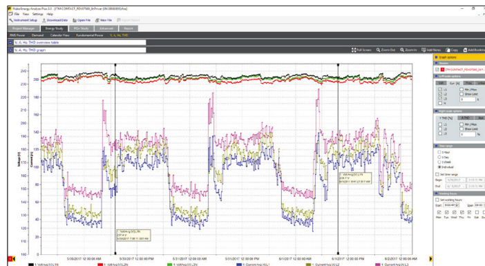
電壓與電流趨勢圖。

記錄器也可直接從測量電路 ( 最高到 500V ) 方便安全地獲得供電—不再需要找尋電源插座，或者必須使用多條延長線接到記錄位置，這對於遠端記錄和電盤內安裝尤其有幫助。