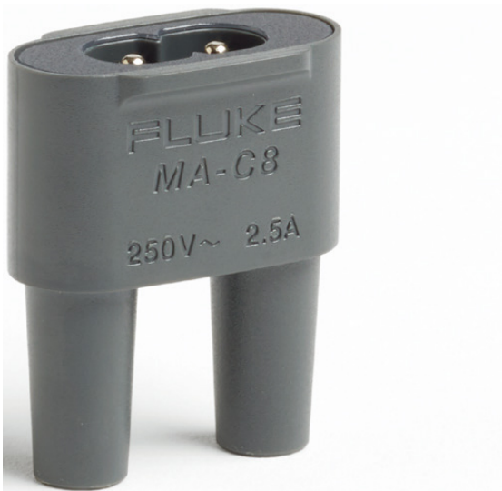
以電源線供電的 MA-C8 變壓器