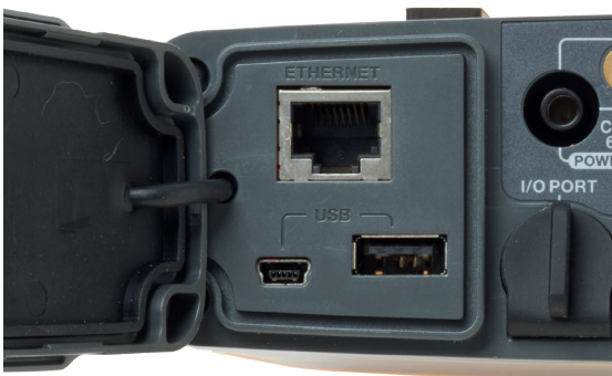
乙太網路和 USB 連接埠