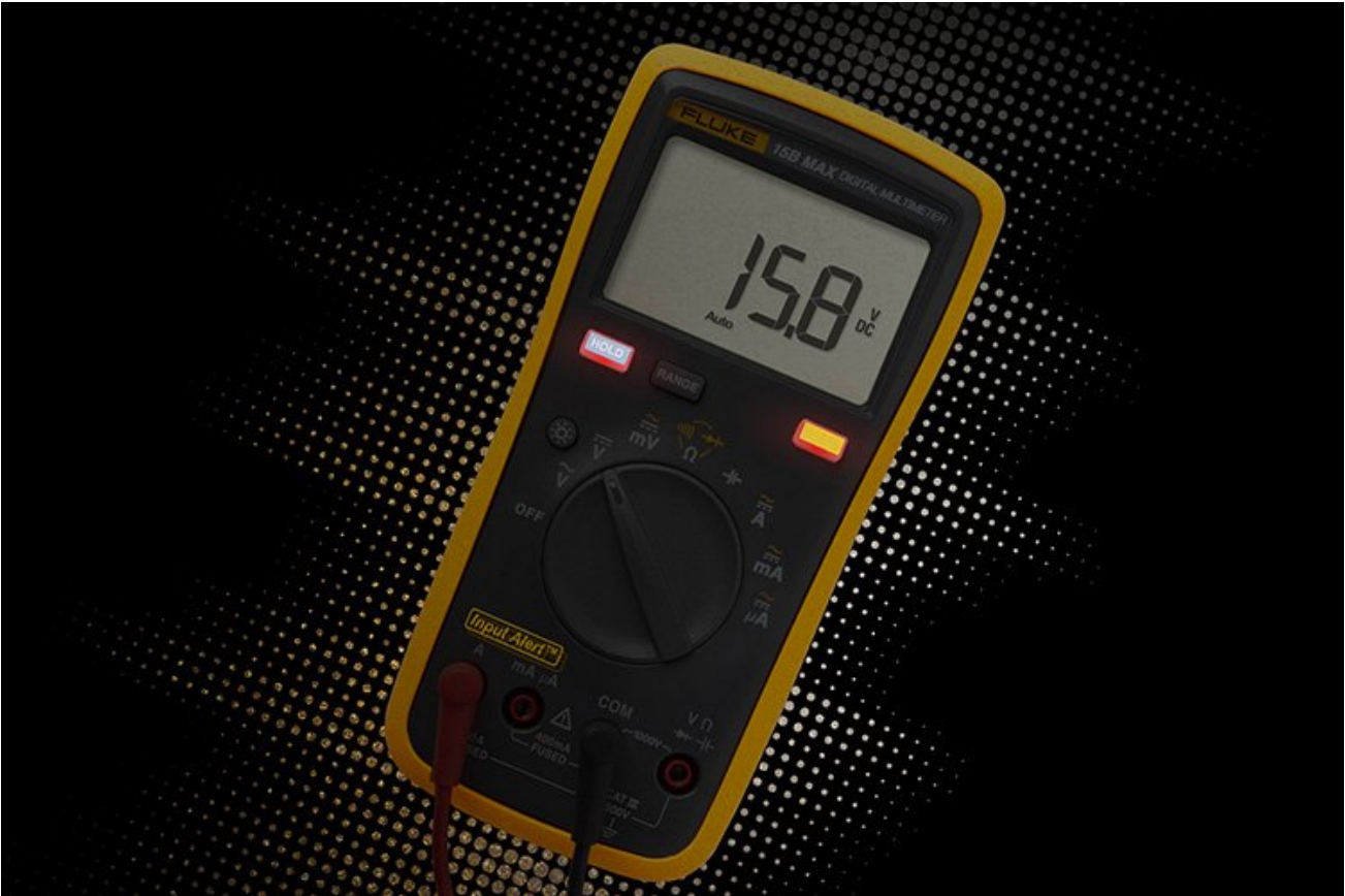
誤操作聲光警示，減少保險絲損壞