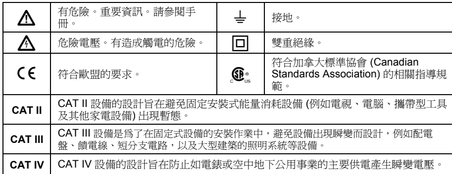
表 1. 符號